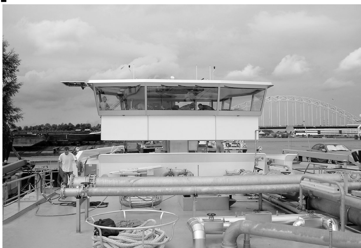
Het stuurhuis is geleverd door Kampers Scheepskonstructie.

'Dat geldt ook voor de door Van Wijk Werkendam ontwikkelde bunkermast, die een maximale hoogte van 1,04 meter ten opzichte van het dek heeft. Het leidingstelsel is in samenwerking